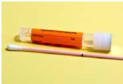
wattenstaafje en buisje