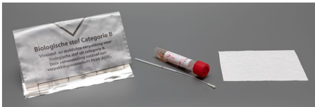
safetybag buisje met rode dop (inclusief UTM) en swab absorptievel

U ontvangt 1 enveloppe met buisje met rode dop inclusief Universeel Transport Medium (UTM), swab, absorptievel en safetybag.