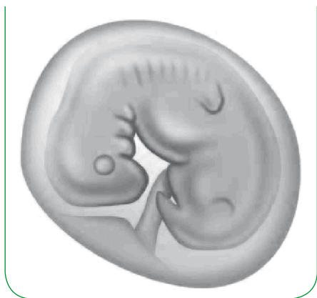
Figuur 1. Bij een normale zwangerschap (zie folder De normale zwangerschap) wordt een vruchtzak aangemaakt met daarin een embryo.

Een miskraam is het verlies van een vroege zwangerschap. Een miskraam wordt ook wel een abortus genoemd. Er zijn verschillende vormen van miskramen te onderscheiden, meestal afhankelijk van het stadium van de zwangerschap waarin de miskraam is opgetreden of afhankelijk van het verloop van de miskraam.