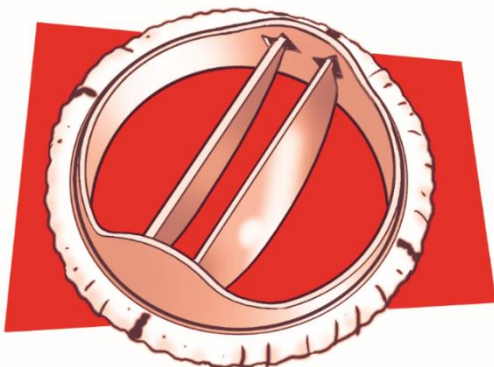
Figuur 3: kunstklep

De mechanische klep of kunstklep is gemaakt van kunststof materiaal. Dit heeft als voordeel dat de klep levenslang meegaat. Een nadeel is dat de klep een tikkend geluid maakt. Ook moet u levenslang antistollingsmiddelen slikken.