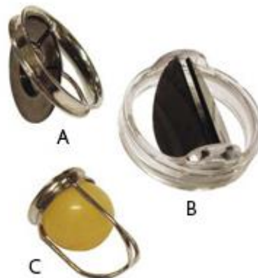
Figuur 4: mechanische kunstkleppen, in werkelijkheid veel kleiner: A. Model met 1 klepblad. B. Model met 2 klepbladen. C. Model 'bal-in-kooi'

Om te ondersteunen bij het maken van een keuze is de website www.hartklepkeuze.nl opgezet. Hier vindt u praktische informatie over hartklepaandoeningen en een keuzehulp. Een keuzehulp geeft informatie over de voor- en nadelen van iedere behandeling en inzicht in uw persoonlijke voorkeuren daarbij.