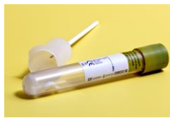
buis en rietje