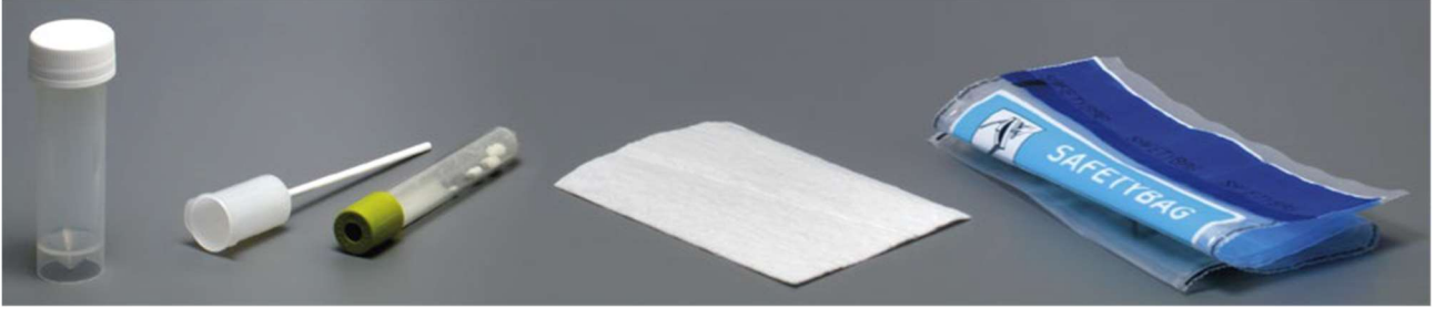
قنينة مع قشة علبة جمع البول