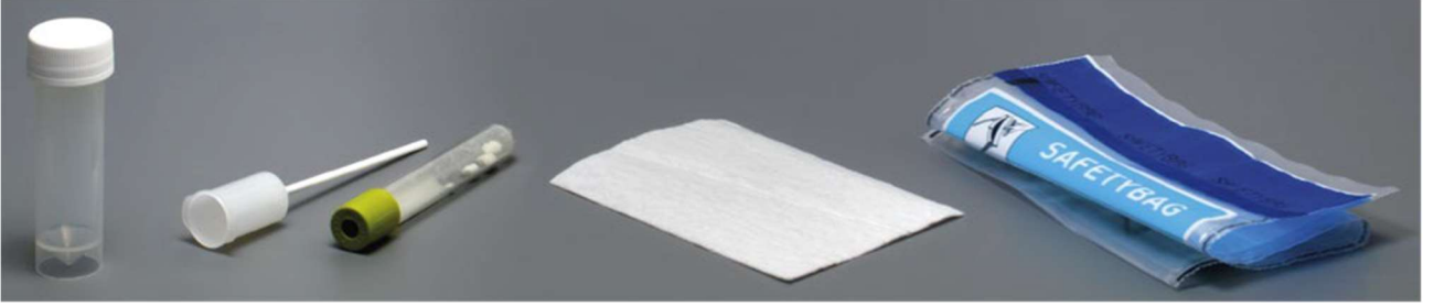
idrar toplama kavanozu