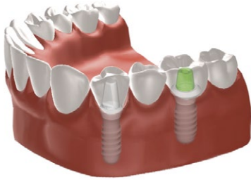
Figuur 3: Brug op 2 implantaten