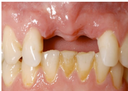
Figuur 5: na verwijdering van twee voortanden