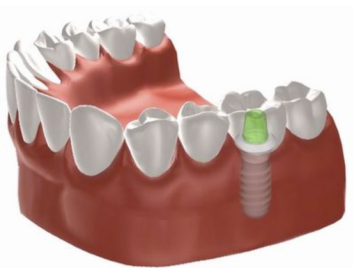
Figuur 2: Kroon op een implantaat