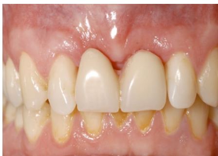
Figuur 6: uitneembare tijdelijke voorziening