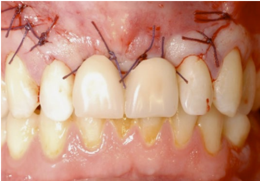
Figuur 8: Uitneembare tijdelijke voorziening