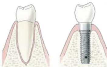
Figuur 1: Natuurlijke tand en een implantaat met een kroon

Het ingroeien van het implantaat in het kaakbot duurt - afhankelijk van de situatie - zo'n 6 tot 12 weken. Hierna kan een kroon (figuur 2) of brug (figuur 3) op het implantaat bevestigd worden. Dit is definitief.