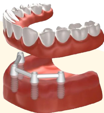
Figuur 3: een implantaat gedragen prothese voor de onderkaak op 4 implantaten met staaf-huls constructie