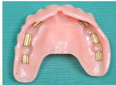
Figuur 5: prothese met hulzen die op de staven wordt 'geklikt'

* MKA staat voor mond-, kaak- en aangezichtschirurgie