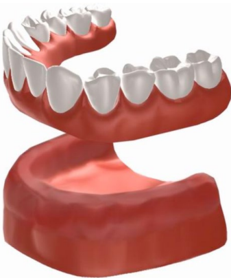
Figuur 1: traditionele prothese

Na het verwijderen van de tanden en kiezen slinkt de kaak. In het eerste jaar verloopt dit snel. Na 1 jaar slinkt de kaak veel langzamer. Een gewone gebitsprothese zuigt zich normaal gesproken vast op het mondslimvlies (figuur 1). Door het slinken van het kaakbot krijgt de prothese minder houvast waardoor deze minder goed blijft zitten. Een slechtzittende prothese is voor veel mensen niet alleen een esthetisch probleem, maar kan ook pijnlijke plekken veroorzaken op het tandvlees. Een prothese op implantaten kan een oplossing zijn voor deze klachten.