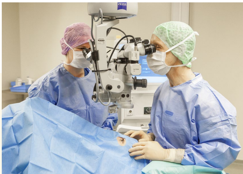
Tijdens de operatie

Als de operatie onder narcose plaatsvindt (locatie Alkmaar), kunt u voor meer informatie de brochure 'Goed voorbereid op uw operatie' lezen.