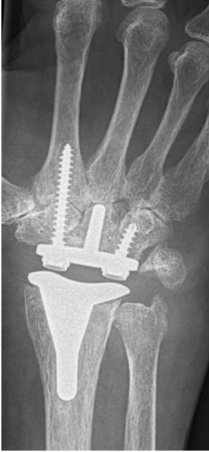
Figuur 4: röntgenfoto van een polsgewricht na het plaatsen van een Freedom® polsprothese.