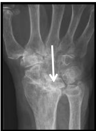
Figuur 2: röntgenfoto van een polsgewricht dat is aangedaan door reuma. De langdurige ontsteking heeft geleid tot slijtage van het polsgewricht. Er is geen gewrichtsspleet meer tussen de handwortelbeentjes omdat het kraakbeen is verdwenen (zie pijl).

Er zijn verschillende aandoeningen die slijtage van het polsgewricht kunnen veroorzaken. Denk hierbij aan reuma of een botbreuk. Bij reuma kan er een ontsteking ontstaan van het polsgewricht. Door zo'n gewrichtsontsteking, ook wel artritis genoemd, is de pols gezwollen, pijnlijk en stijf. Als een ontsteking lang duurt, kan dit ook nog leiden tot aantasting van het kraakbeen en de ligamenten. Er ontstaat slijtage (zie figuur 2). Ook kan er slijtage van het polsgewricht optreden door een ernstige breuk van het polsgewricht of door een verscheuring van de ligamenten van de pols. Dit treedt meestal pas vele jaren na het ongeval op. Net als bij een artritis is bij slijtage van de pols het gewricht gezwollen, pijnlijk en stijf. De slijtage op zich kan ook weer aanleiding geven tot een ontsteking van het gewricht met toename van de klachten.