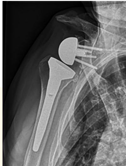
Omgekeerde (reverse) schouderprothese