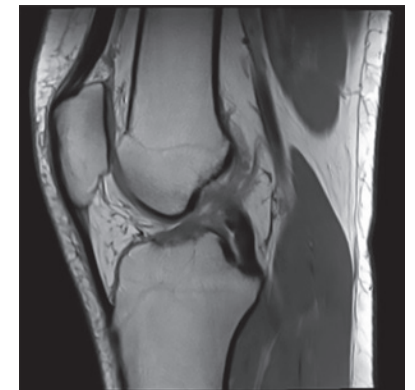
MRI: voorste kruisband gescheurd