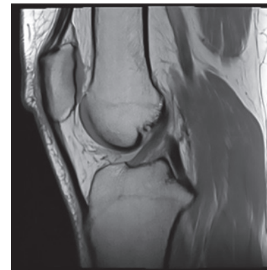
MRI: voorste kruisband intact

Tijdens het sporten of het maken van een verkeerde draai beweging kan de voorste kruisband scheuren. U zakt door uw knie of verdraait uw knie. Vaak wordt een knappend gevoel in de knie ervaren. Zwellt u knie direct erna erg op, dan is er een kans dat uw voorste kruisband gedeeltelijk of volledig gescheurd is. De klachten variëren: vrijwel geen klachten, een instabiel gevoel ervaren of door uw knie zakken. Pijn heeft vaak een andere oorzaak dan een gedeeltelijk of volledig gescheurde voorste kruisband. Meestal is een ander letsel de veroorzaker van pijn, zoals kraakbeenschade, een gescheurde meniscus of een botkneuzing. Om er zeker van te zijn dat uw voorste kruisband gescheurd is, gaat de orthopedisch chirurg uw klachten na, wordt er een lichamelijk onderzoek van de knie gedaan, een röntgenfoto gemaakt en eventueel een MRI-scan aangevraagd. Soms is een kijkoperatie nodig om de diagnose te bevestigen.