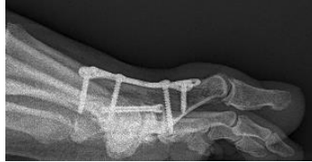
Vastzetten teen met schroeven of plaat met schroeven