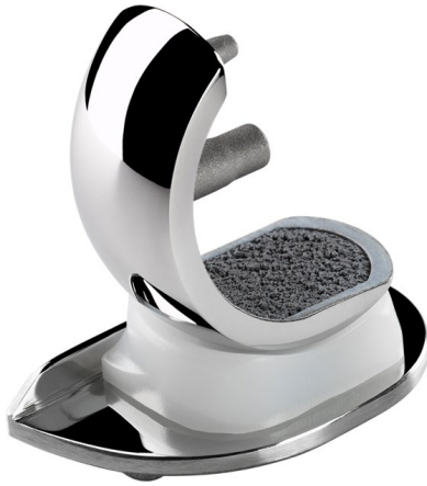
Figuur 3: Een van de door ons gebruikte prothese.