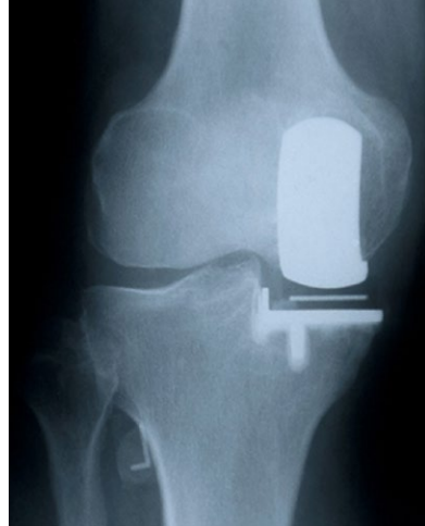
Figuur 4: rontgenfoto van een van de door ons gebruikte prothese.