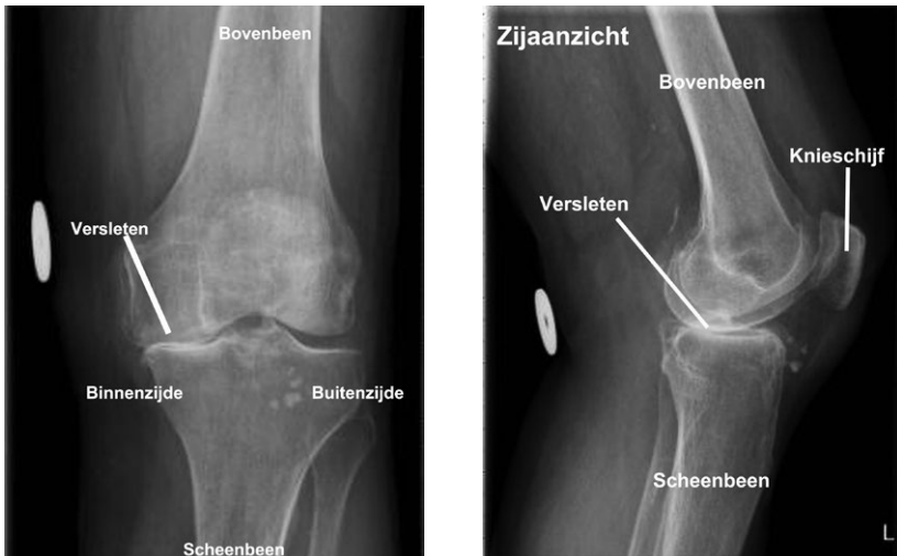
Figuur 1 & 2: Artrose van de knie gezien van voren en van de zijkant

Als de kwaliteit van het kraakbeen vermindert, spreken we van slijtage (artrose). Dit kan in de hele knie of in 1 helft voorkomen. Als al het kraakbeen of het grootste deel ervan weg is, dan spreken we van een versleten knie. Omdat de botten dan over elkaar heen schuren, raakt het gewricht geïrriteerd. Dit veroorzaakt pijn. Er kan een hemi-knieprothese overwogen worden, als fysiotherapie, medicijnen en het aanpassen van uw levensstijl onvoldoende helpen. Met het aanpassen van uw levensstijl bedoelen we bijvoorbeeld gewichtsvermindering of meer bewegen.