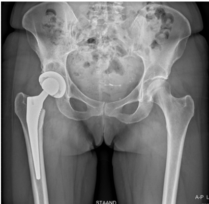
Illustratie 3: röntgenfoto van de geplaatste totale heupprothese.

Bij een gecementeerde heupprothese wordt in het bekken ruimte gemaakt voor een kunststof kom. De versleten heupkop wordt vervangen door een keramische kop. De steel van deze kop wordt in het bovenbeen geplaatst. De steel én de kom worden met cement vastgezet.