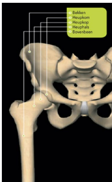
Illustratie 1: Heupgewricht met de heuphals (dijbeenhals) en het bovenbeen (dijbeen)

Het heupgewricht is een kogelgewricht dat bestaat uit een heupkop op het bovenbeen en een heupkom in het bekken. Beide zijn bedekt met een laag kraakbeen. Dit is glad en verend weefsel dat er in combinatie met gewrichtsvocht voor zorgt dat de kop soepel beweegt in de kom. Als het kraakbeen minder van kwaliteit wordt en slijt (artrose), ontstaat rechtstreeks contact op de botten. Dit veroorzaakt pijn en ontstekingsverschijnselen. We spreken dan van een versleten heup oftewel artrose van de heup (coxartrose).