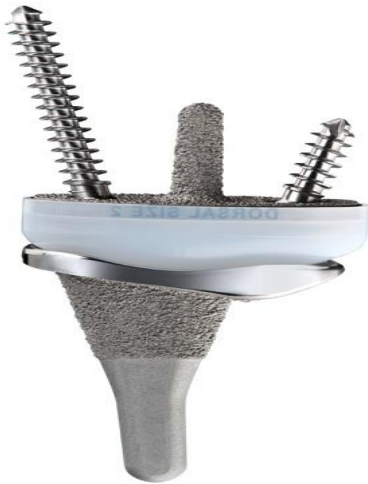
Figuur 3: de Freedom® polsprothese.