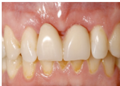
Figuur 6: uitneembare tijdelijke voor- ziening