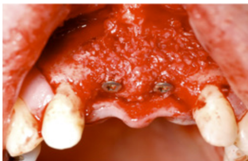
Figuur 7: implanta- ten en bot-schraapsel

Als het bot en implantaat na 6 maanden goed zijn ingegroeid - dit wordt met een röntgenfoto gecontroleerd - wordt het tandvlees nog een keer opengemaakt. Het implantaat wordt vrijgelegd. Op het implantaat wordt een afdekschroef geplaatst (figuur 9). Deze is in de mond te zien. De tijdelijke uitneembare voorziening wordt aangepast en kunt u weer dragen. Kort hierna kan uw tandarts een kroon of brug maken en plaatsen.