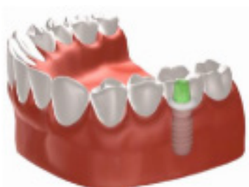
Figuur 2: Kroon op een implantaat