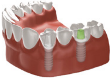
Figuur 3: Brug op 2 implantaten