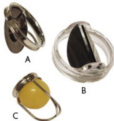
Figuur 4: mechanische kunstkleppen, in werkelijkheid veel kleiner A. Model met 1 klepblad. B. Model met 2 klepbladen. C. Model 'bal-in-kooi'

Om te ondersteunen bij het maken van een keuze is de website hartklep.keuze.nl opgezet. Hier vindt u praktische informatie over hartklepaandoeningen en een keuzehulp. Een keuzehulp geeft informatie over de voor- en nadelen van iedere behandeling en inzicht in uw persoonlijke voorkeuren daarbij. Om de keuzehulp te doorlopen moet u eerst inloggen.