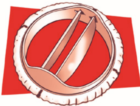
Figuur 3: kunstklep (bron: Hartstichting 2021)

De mechanische klep of kunstklep is gemaakt van kunststof materiaal. Dit heeft als voordeel dat de klep levenslang meegaat. Een nadeel is dat de klep een tikkend geluid maakt. Ook moet u levenslang antistollingsmiddelen slikken.