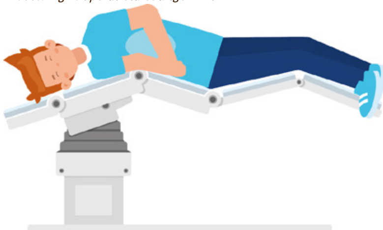
Afbeelding 2: operatietafel uitgeknikt

De uroloog verwijdert de aangedane nier en urineleider. De nier en urineleider worden na de operatie opgestuurd naar het laboratorium voor weefselonderzoek. De uroloog sluit vervolgens de wond en laat een dun slangetje achter. Dit noemen we een wonddrain en is nodig om wondvocht af te laten lopen. De operatie duurt ongeveer 3 uur.