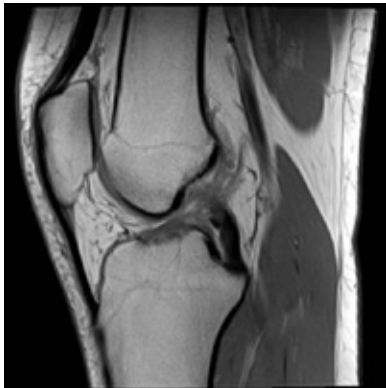
MRI: voorste kruisband intact

Tijdens het sporten of het maken van een verkeerde draaibeweging kan de voorste kruisband scheuren. U zakt door uw knie of verdraait uw knie. Vaak wordt een knappend gevoel in de knie ervaren. Zwelt u knie direct erna erg op, dan is er een kans dat uw voorste kruisband gedeeltelijk of volledig gescheurd is. De klachten variëren: vrijwel geen klachten, een instabiel gevoel ervaren of door uw knie zakken. Pijn heeft vaak een andere oorzaak dan een gedeeltelijk of volledig gescheurde voorste kruisband. Meestal is een ander letsel de veroorzaker van pijn, zoals kraakbeenschade, een gescheurde meniscus of een botkneuzing. Om er zeker van te zijn dat uw voorste kruisband gescheurd is, gaat de orthopedisch chirurg uw klachten na, wordt er een lichamelijk onderzoek van de knie gedaan, een röntgenfoto gemaakt en eventueel een MRI-scan aangevraagd. Soms is een kijkoperatie nodig om de diagnose te bevestigen.