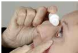
Druppeltechniek 1 zijaanzicht