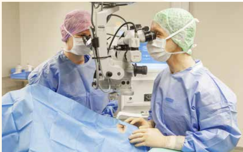
Tijdens de operatie

U ligt tijdens de operatie ongeveer 30 minuten op een stoel. Uw gezicht wordt afgedekt met een doek, waaronder extra frisse lucht stroomt. Tijdens de operatie wordt het oog opengehouden met een ooglidspreider. De oogartsen van Noordwest Ziekenhuisgroep passen de modernste operatietechnieken toe, namelijk phaco-emulsificatie met een opvouwbare kunstlens. Het kan zijn dat de oogarts tijdens de operatie een reden heeft om de techniek wat aan te passen. De oogarts vertelt u dan waarom dat nodig is en wat er gebeurt.