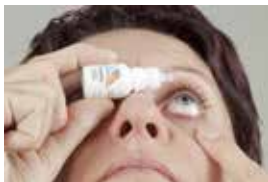
Druppeltechniek 1 zelf druppelen

Op de foto's kunt u goed zien hoe u uw oog moet druppelen.