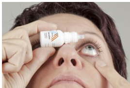
Druppeltechniek 1 zelf druppelen

U druppelt de eerste 2 weken na de operatie 4 keer per dag, namelijk om 8:00 uur, 12:00 uur, 18:00 uur en om 22:00 uur. Daarna gaat u de druppels per week afbouwen volgens het schema op het recept. Alleen als de oogarts iets anders met u heeft afgesproken, volgt u een ander schema. Op de foto's hieronder kunt u goed zien hoe u uw oog moet druppelen.