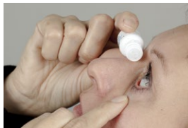
Druppeltechniek 1 zijaanzicht